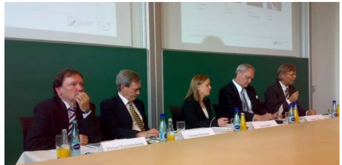
Die Vortragenden vertieften ihre Ausführungen zur Service-Dominant Logic im Rahmen der Panel Discussion und beantworteten die Fragen der Zuhörer