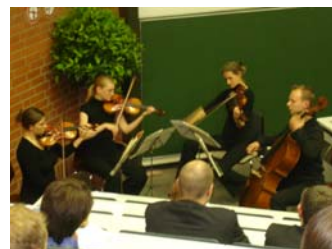
Für die musikalische Umrahmung sorgte ein Streichquartett des Sinfonieorchesters der Universität Bayreuth