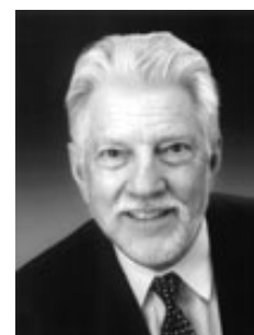
Professor Everett M. Rogers *

Professor Everett M. Rogers ist am 31. Oktober 2004 im Alter von 73 Jahren verstorben.