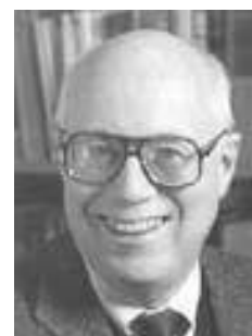
Professor Frederic M. Scherer

Structure and Economic Performance oder The Economics of Multi-Plant Operation: An International Comparisons Study.