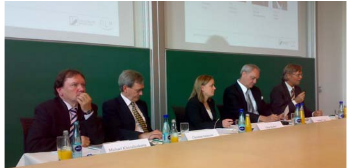
Die Vortragenden vertieften ihre Ausführungen zur Service-Dominant Logic im Rahmen der Panel Discussion und beantworteten die Fragen der Zuhörer