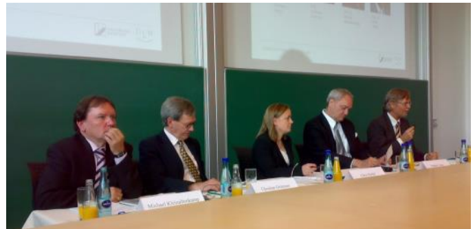
Die Vortragenden vertieften ihre Ausführungen zur Service-Dominant Logic im Rahmen der Panel Discussion und beantworteten die Fragen der Zuhörer