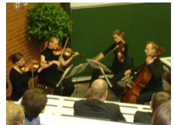
Für die musikalische Umrahmung sorgte ein Streichquartett des Sinfonieorchesters der Universität Bayreuth