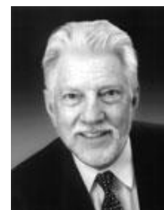
Professor Everett M. Rogers *

Professor Everett M. Rogers ist am 31. Oktober 2004 im Alter von 73 Jahren verstorben.